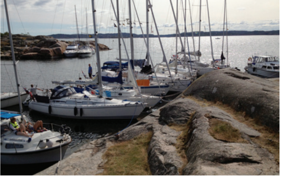
Eng aber sicher: Schärenmängel sind unverzichtbar.