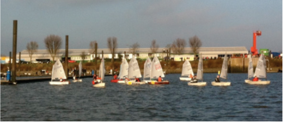
Nur die kahlen Bäume erinnern daran, dass Winter ist.

verkauf, an die tolle See-Mannschaft auf den Begleitbooten und an den heißen Oldtime-Jazz.