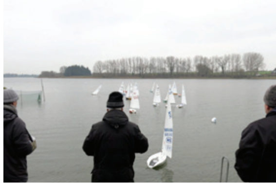
Auch Modelle, hier auf dem Passader See, brauchen Wind.

Die Passader Aalregatta am 30.11.2014 ist die jüngste Veranstaltung im MC-Kalender. Johann Rathjen hat in diesem Jahr zum zweiten Mal die Veranstaltung ausgerichtet. Im landschaftlich toll in der Probstei gelegenen Passade gibt es neben dem See auch ein sehr schönes Hotel/Cafe mit direktem Blick auf die Regattabahn. Das ist bei den diesmal vorherrschenden Bedingungen mit Ostwind und Temperaturen um den Gefrierpunkt ein sehr schlagendes Argument. Der Wirt der „Fischerwiege“ hat extra für uns seine Winterpause unterbrochen. Hierfür