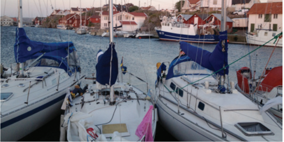
„Samson“ in Klädesholm.

Heckanker. Ich als Einzige (deutscher Laie!) längsseits!