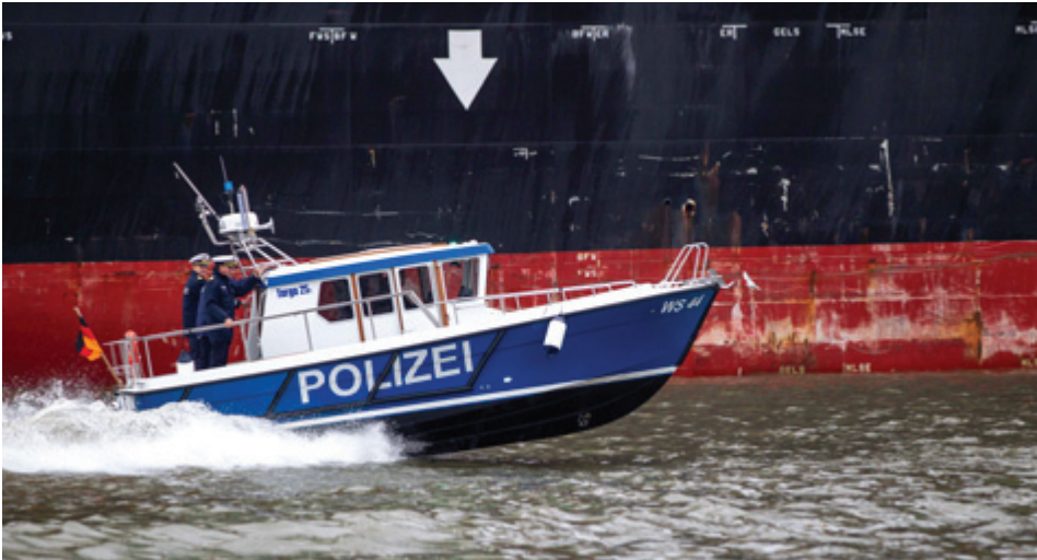
Eins der beiden neuen Polizeiboote vor der Bordwand eines Containerschiffs.

einem VOLVO PENTA D4-260 wassergekühlten Vierzylinder mit 16-Ventil-Viertakt-Diesel-Innenbordmotoren mit elektronisch geregelt Commonrail-Hochdruck-Einspritzsystem und Z-Antrieb. Das verleiht ihnen mit drei Personen an Bord eine maximale Dauergeschwindigkeit von 25 Knoten. Die Normalbesatzung jedes Bootes beträgt aber nur zwei Personen. Die neuen Boote sind aber nicht nur schnell, sondern auch seetüchtig. So sollen sie bis Windstärke 8 Bft und einer Seegangshöhe von vier Metern Höhe einsetzbar sein.