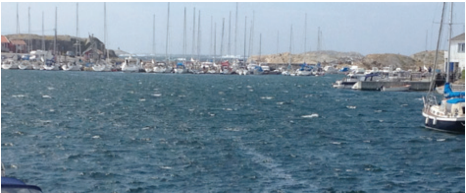
Lieber nicht auslaufen!

Die Schweden sind bewundernswert cool im Festmachen an nahezu nichts und beim Überqueren von Untiefen, die in meiner Karte einen Meter flach sind. So etwas geht nur mit Kartenplotter, dachte ich immer, bis mir eine Schwedin erzählte, dass die meisten Einheimischen am liebsten nur mit Seekarte durch