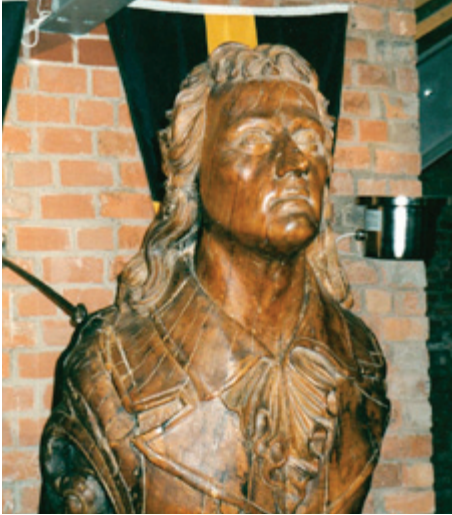
Unser Schiller sah nur wenig vom Hochwasser.

SVAOe: Bei allem Spaß lernen die jungen Leute bei uns eine Menge.