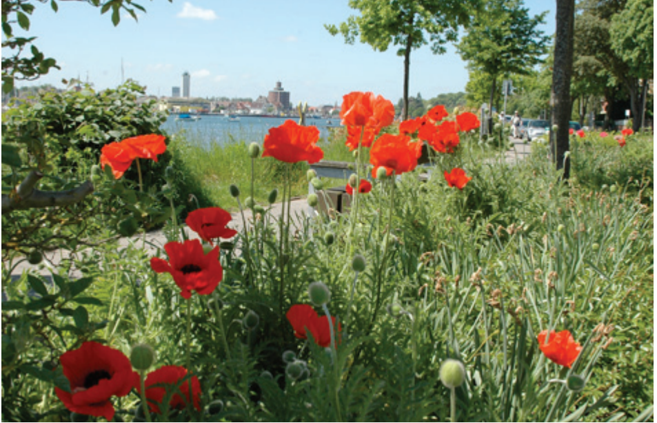
Sommerliche Blumenpracht am SVAOe-Steg in Eckernförde.