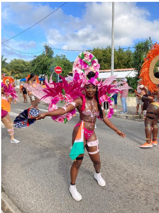
Carneval auf St.Maarten

Am nächsten Tag steht schon Karneval auf dem Programm, nicht nur in Deutschland sind die „Jecken“ unterwegs; auf den karibischen Inseln stept der Bär ebenso. Auch wenn ich noch nie beim deutschen Karneval war, würde ich die steile These aufstellen, dass es deutlich angenehmer bei karibischen Temperaturen ist. Dementsprechend leicht bekleidet tanzen die Einwohner hinter und auf den LKWs zu Reggae Beats die Straßen entlang.