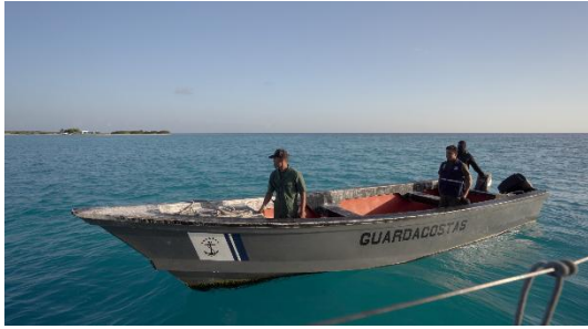
Freund oder „Feind“?

während wir mit dem Fernglas den Stützpunkt beobachten. Wir erkennen drei Militärs in verschiedenen Uniformen, die zu unserem Boot fahren. Einer von ihnen ist beängstigend stark vermummt und ein anderer hat einen Lolli im Mund – in mir kommen ambivalente Gefühle hoch. Sind das nun krasse Respektspersonen oder lockere Kollegen?